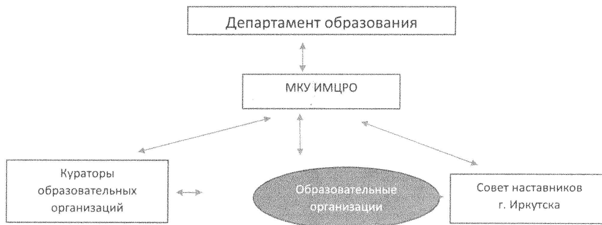
Рис. 1. Блок -схема структуры управления системой наставничества

3.1. Структура управления процессом внедрения и реализации муниципальной модели наставничества г. Иркутска в образовательных организациях включает в себя: